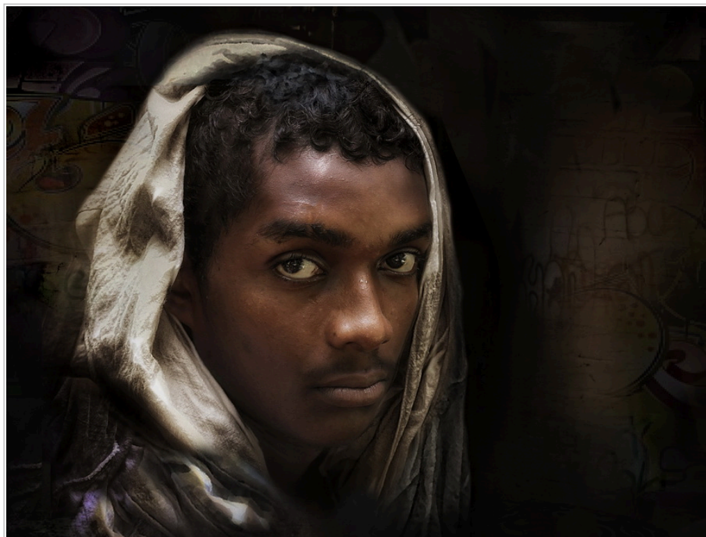
Portret van Nicolaas Porter

Er zijn diverse verhalen die mij enorm geraakt hebben. Een van de verhalen ging over de kinderen van de slaven, in het bijzonder meisjes en tienermeisjes, die op jonge leeftijd gedwongen werden om in de seksuele behoeften van de slaveneigenaren te voorzien; ze werden verkracht. Hun ouders hadden het recht niet om hen te beschermen, omdat ook deze kinderen als slaven beschouwd werden en niets anders waren dan vleselijke eigendommen. In het verlengde hiervan, vertelden twee vrouwen aan mij dat veel vrouwelijke nazaten tegenwoordig nog steeds last hebben van deze gruweldaden: men voelt zich “vuil” en “vies”, men voelt zich afgewezen en heeft moeilijkheden om gezonde en stabiele relaties aan te gaan.